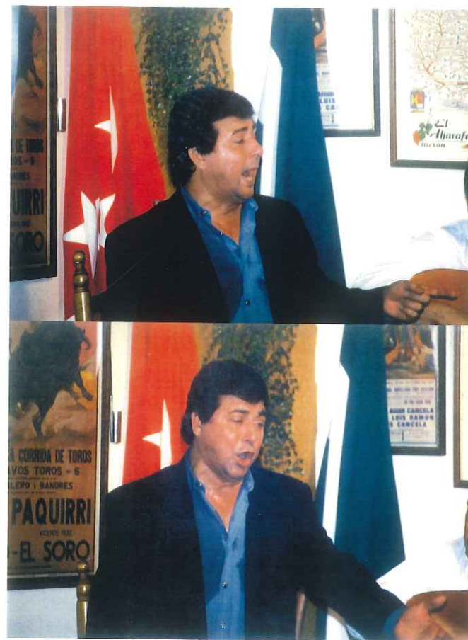
Dos expresiones del cantaor Fernando Gálvez, durante su actuación en un Centro Cultural Flamenco